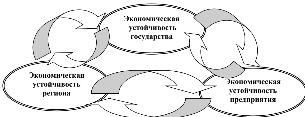
Рис 1. Взаимосвязь категорий экономической устойчивости.

Важно отметить, что существует несколько категорий экономической устойчивости: государства, региона и предприятия. И для каждого из них экономическая устойчивость характеризуется различными количественными и качественными параметрами.